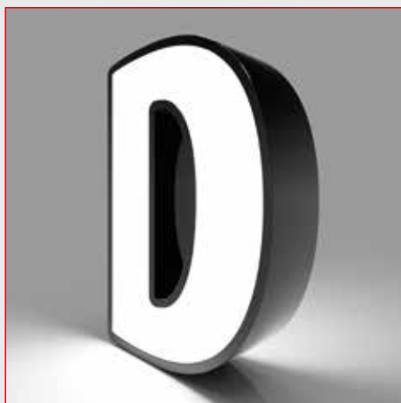
profil 05 - d-light front- u. rückleuchter