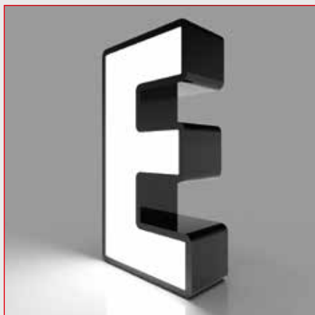
profil 05 - f-light frontleuchter