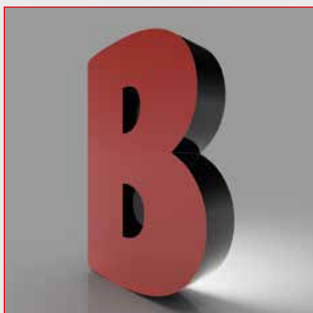
profil 03 - b-light rückleuchter